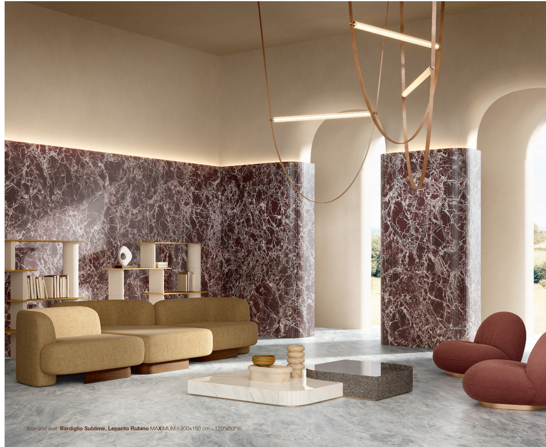
floor and wall: Bardiglio Sublime, Lepanto Rubino MAXIMUM / 300x150 cm - 120"x60" in